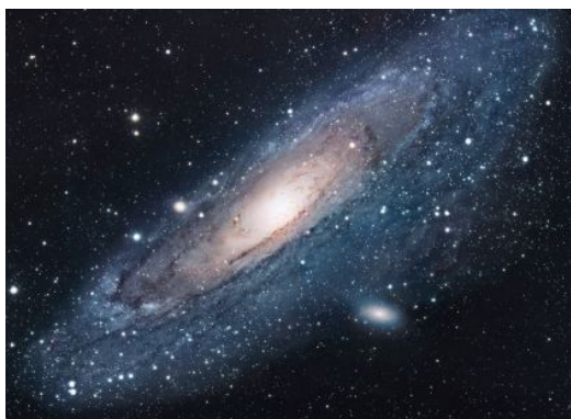
Рис. 1. Пример рисунка

В рисунках не рекомендуется использовать шрифт менее чем 9 pt. Далее несколько примеров рисунков.